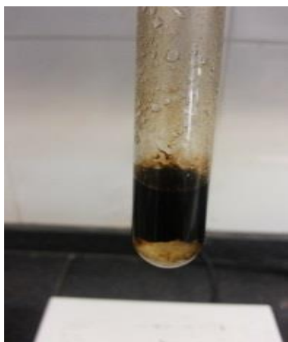
شکل ۲- بررسی فعالیت امولسیون‌کنندگی در نمونهٔ J3

توانایی هریک از جدایه‌ها در حذف نفت طی مدت ۲۱ روز در محیط کشت پایهٔ نمکی حاوی ۱ درصد نفت بررسی شد و جدایه‌های J3، J5 و J12 بیشترین درصد حذف نفت را به خود اختصاص دادند (جدول ۲). غلظت اجزای ترکیبات آلیفاتیک و آروماتیک موجود با دستگاه کروماتوگرافی گازی (GC-MS) تعیین و جدایهٔ J3 پس از ۲۱ روز، میزان TPH در نفت خام را به میزان ۹۹/۸ درصد کاهش داد.