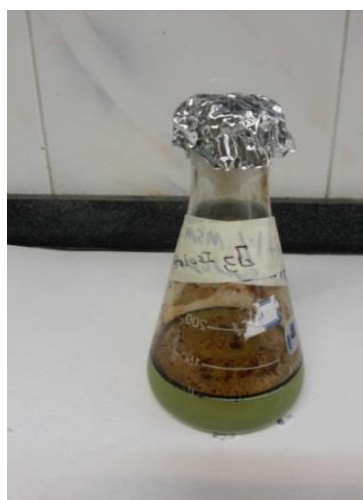
شکل ۱-ب- ارلن تیمار شده با جدایهٔ J3 در محیط کشت MSM همراه با ۱ درصد نفت خام در مقایسه با نمونهٔ شاهد MSM بدون باکتری

حلقهٔ دونوی ۵ انجام می‌شود (۲۰) و بر اساس رابطهٔ W=2\pi r\gamma که w وزن قطره، r شعاع لولهٔ موئین و \gamma کشش سطحی مایع است اندازهٔ قطره با شعاع مجرا رابطهٔ مستقیم دارد. با توجه به اینکه کاهش کشش سطحی به کمتر از ۴۰ میلی‌نیوتن بر متر شاخص تولید بیوسورفکتانت در نظر گرفته می‌شود، آزمایش تولید بیوسورفکتانت نشان می‌دهد این جدایه‌ها کاهش کشش سطحی را به خوبی نشان می‌دهند (جدول ۱). بر اساس نتایج، جدایهٔ J3 قادر به بیشترین کاهش کشش سطحی (از ۶۳ به ۳۷/۸۵ میلی‌نیوتن بر متر) در مقایسه با نمونهٔ شاهد است.