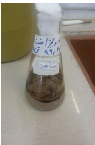
شکل ۱ الف- ارلن تیمار شده با جدایه J3 در محیط کشت MSM همراه با ۱ درصد نفت خام در مقایسه با نمونه شاهد MSM بدون باکتری

به منظور افزایش دادن احتمال جداسازی باکتری‌های مولد بیوسورفکتانت، تمام نمونه‌های جمع‌آوری شده در محیط کشت اختصاصی باکتری‌های تجزیه‌کننده نفت (MSM حاوی ۱ درصد نفت خام به‌عنوان تنها منبع کربن و انرژی) کشت داده شدند (شکل ۱). روش همولیز روی محیط آگار خون‌دار یک روش غربال‌گری اولیه در تولید بیوسورفکتانت است و مشاهده همولیز در محیط کشت آگار نشان‌دهنده کاهش کاهش سطحی گلبول‌های قرمز خون و لیز شدن آنها در اثر رشد باکتری‌های یادشده و در واقع، توانایی تولید بیوسورفکتانت آنها است.